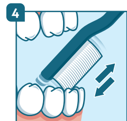
4 Dents de devant : placer la brosse verticalement en allant toujours de la gencive vers la dent.